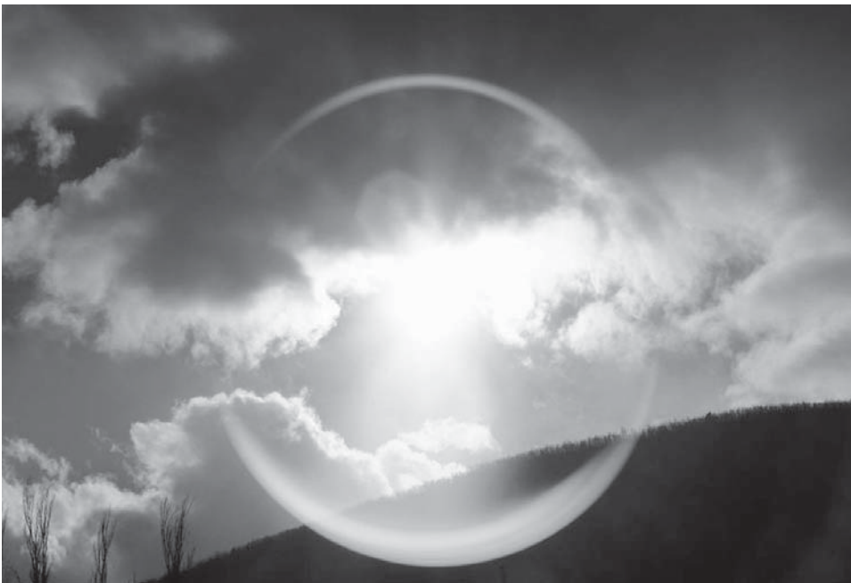
Perëndimi i diellit në qytetin e Pejës.