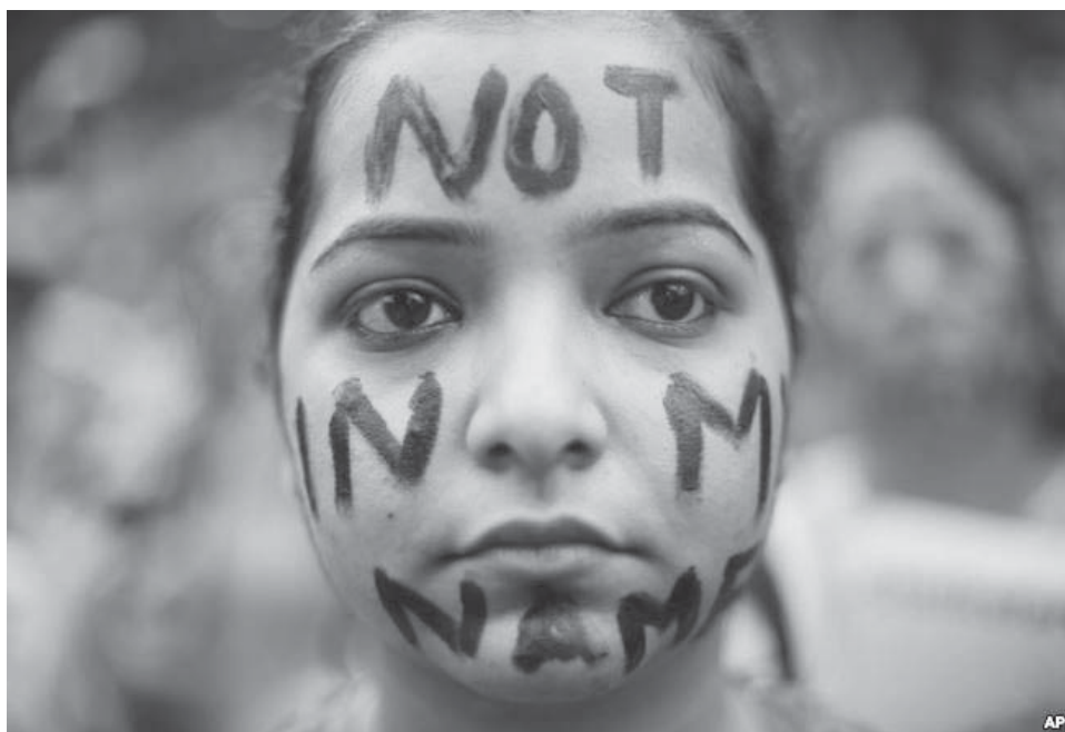
Një qytetare proteston pranë Parlamentit në Nju Delhi kundër dy rasteve të femrave të përdhunura kohët e fundit në Indi.