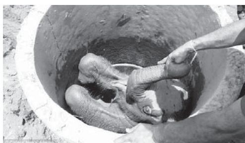
metrash brenda pusit në Ampara, Sri Lanka. Një ekip shpëtimi erdhi në vendngjarje pasi fshatarët lëshuan alarmin.

Një elefant i vogël ka rënë brenda një pusi në përpjekje për të pirë ujë. Rënkimet e katërmujshit për ndihmë u dëgjuan nga banorët e zonës të cilët e gjetën në një thellësi prej 1.8