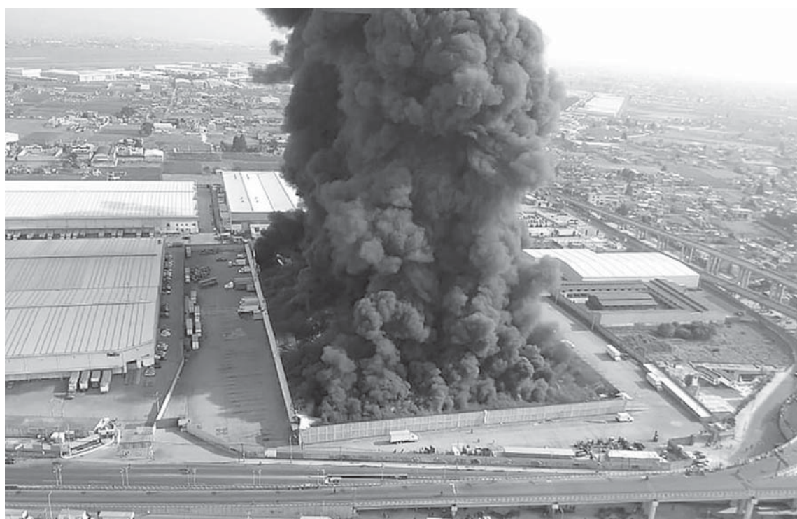
Një zjarr në një fabrikë të pëlhurave ka detyruar autoritetet t'i pezullojnë operacionet në aeroportin e qytetit dhe në rrugët e afërta në Toluca, Meksikë.