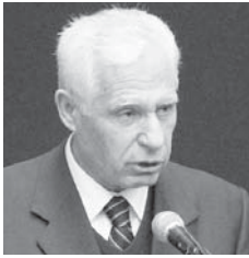
Përgatiti: Selatin NOVOSELLA

Bacë, çka të them!... E paça në kujtesë shëmbëlltyrën Tënde derisa të vijë te Ju!