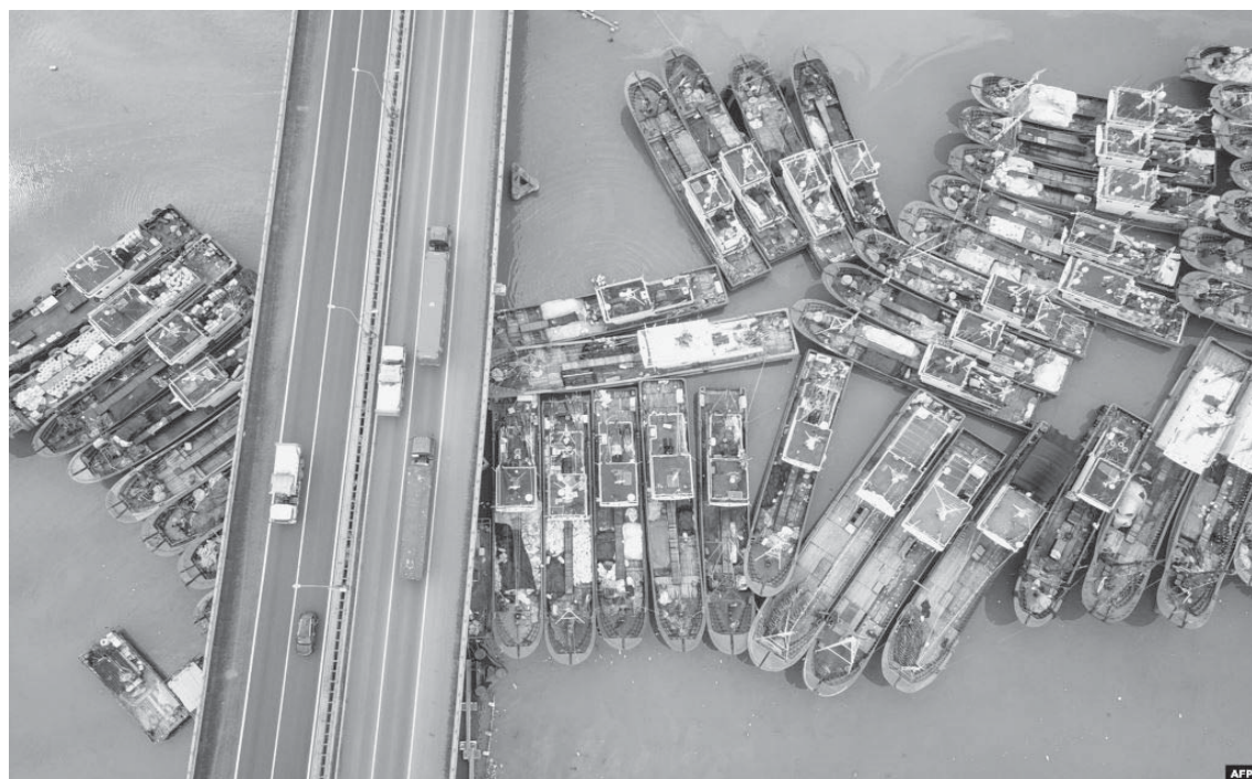
Ky imazh ajror tregon anijet peshkimi në ditën e fundit të moratoriumit të peshkimit veror në provincën Jiangsu të Kinës.