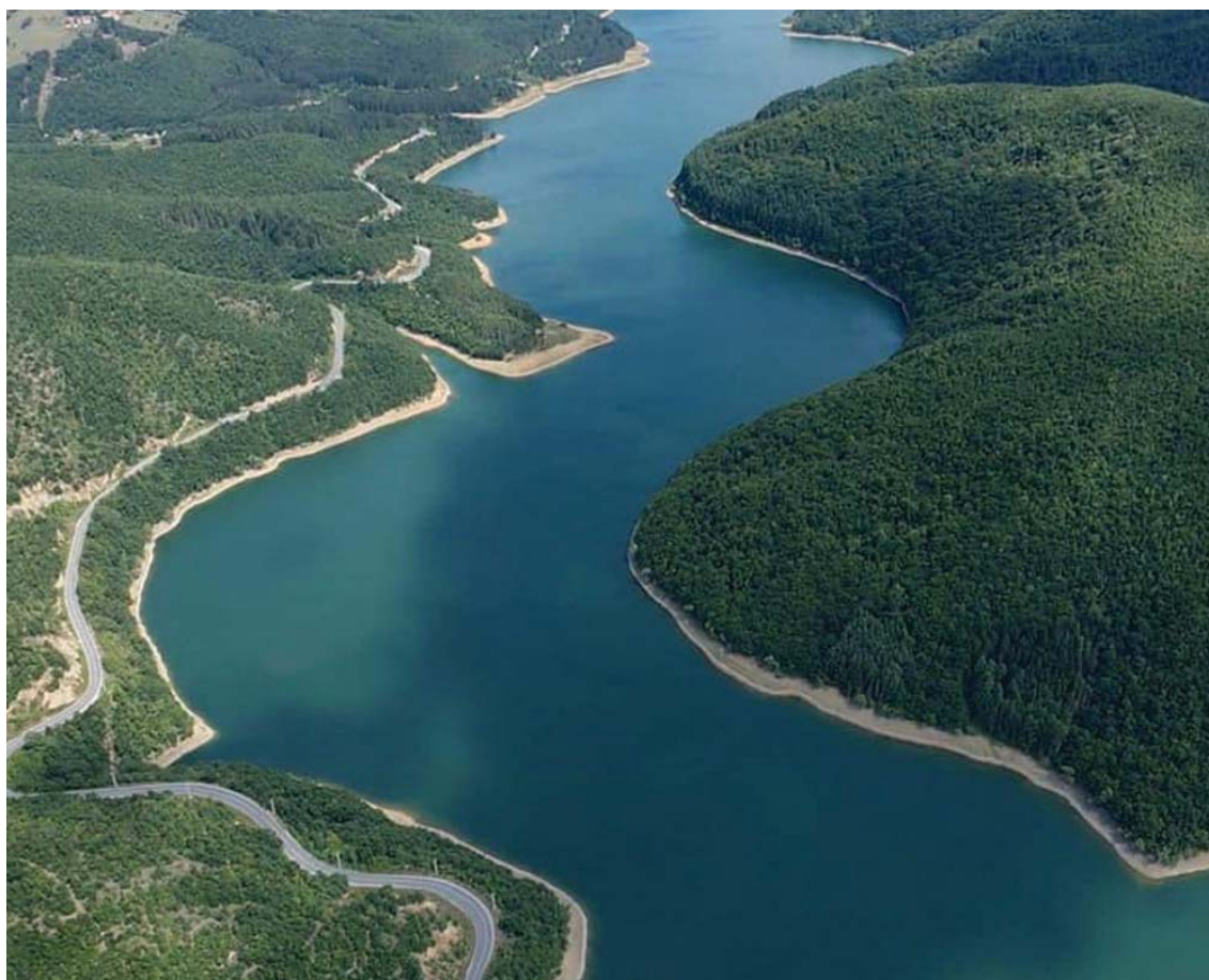
Pamje e liqenit të Batllavës në ditët e nxehta të verës.