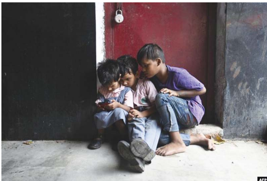
Fëmijët luajnë me një celular në një treg në New Delhi në Indi.