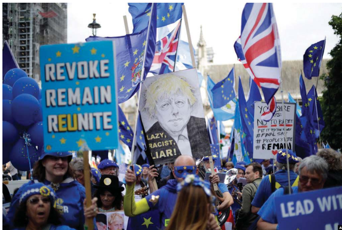
Përkrahësit pro Bashkimit Evropian protestojnë para ndërtesës së Parlamentit në Londër.