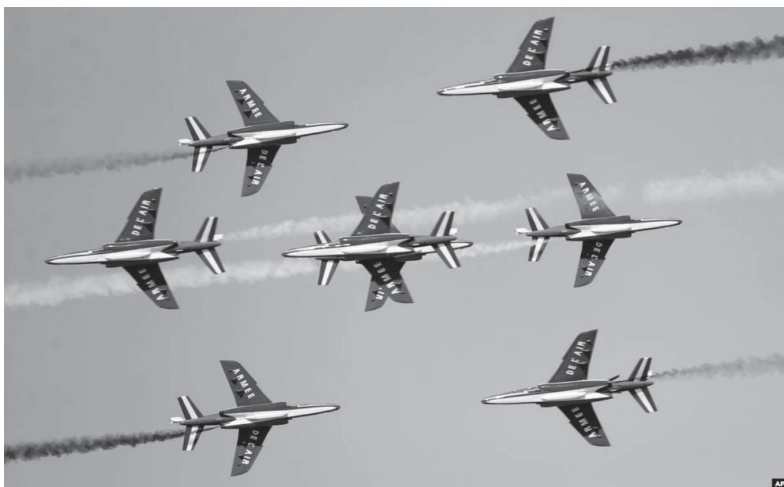
Aeroplanët francezë shfaqin flamurin e Francës gjatë një shfaqjeje në Emiratet e Bashkuara Arabe