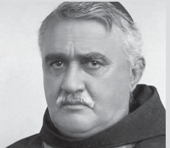
Poezi nga: Gjergj FISHTA

Dersa t'mundem me ligjrue, E sa gjall me frymë un jam Kurr Shqypni s'kam me t'harrue Edhe n'vorr me t'përmend kam.