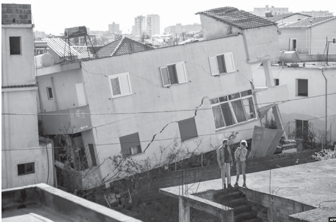
Një djalë dhe një vajzë qëndrojnë para një ndërtese të shembur si pasojë e tërmetit në qytetin e Durrësit.