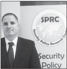
Shkruan: TAHIR AHMETI

Fatkeqësitë natyrore janë të paparashikueshme, me intensitete dhe efekte të ndryshme, të cilat mund të godasin në çdo çast, duke shkaktuar humbje të konsiderueshme të jetëve të njerëzve dhe të mirave materiale.