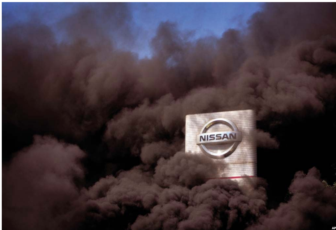
Tymi si pasojë e djegies së gomave gjatë një proteste në Barcelonë mbulon logon e fabrikës Nissan.