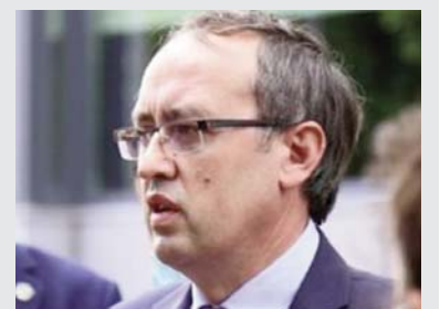
Hashim Thaçi, Kadri Veseli dhe të tjerë akuzohen për krime kundër njerëzimit dhe krime lufte.

plotësisht funksionale dhe kushtetuese dhe për aq kohë sa është një qeveri që është funksionale, që ka mbështetjen e shumicës së deputetëve në Kuvendin e Kosovës, duhet të vazhdojë", është shprehur Hoti. Javën e kaluar, Zyra e Prokurorit të Specializuar ka njoftuar se më 24 prill u ka dërguar Dhomave të Specializuara të Kosovës, me seli në Hagë, një aktakuzë me dhjetë pika për shqyrtim, në të cilën