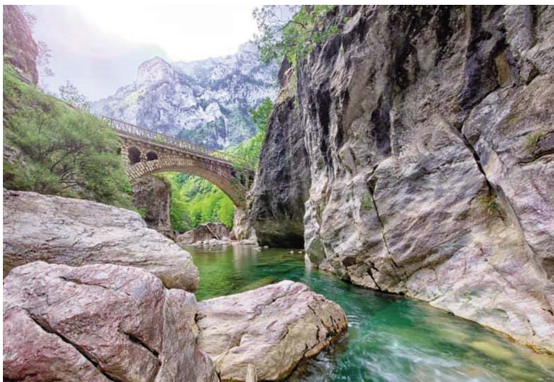
Pamje e bukur nga gryka e Rugovës në Pejë