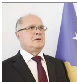
Shkruan: Ramiz KELMENDI

Pamfleti nga Gjykata e Hagës e ndaloi, preu përkohësisht, një marrëveshje ndërkombëtare jetike për të ardhmen e shtetit të Kosovës, një marrëveshje e cila do ndodhte nga ajo Shtëpi e Bardhë që urdhëroi forcat e NATO-s ta bombardonin Serbinë në vitin 1999. Hapja e paraprocedurës në këtë kohë, hapja e paraprocedurës për kreun e UÇK-së, për kreun e PDK-së, dy personalitetet e rëndësishme të jetës politike dhe institucionale të shtetndërtimit, hapja e paraprocedurës për presidentin e vendit, janë jashtëzakonisht të dëmshme, nëse bëhen të plotfuqishme,