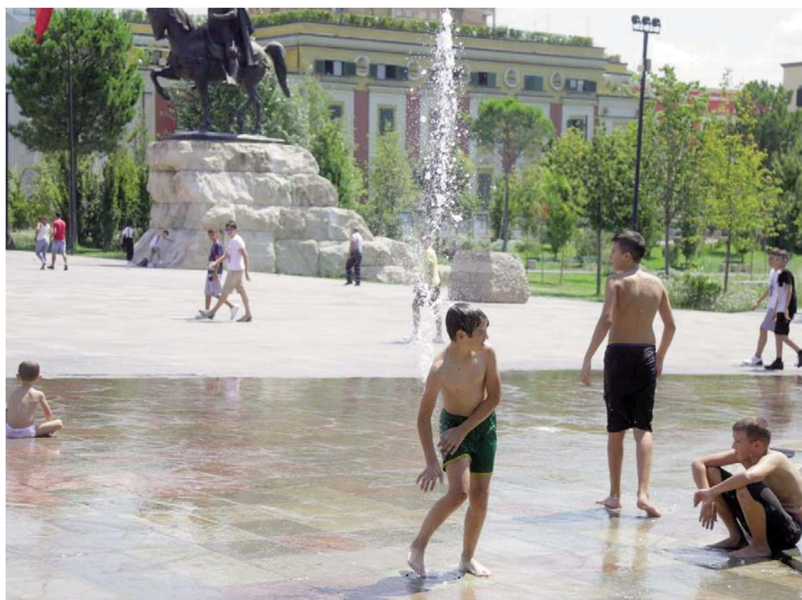
Qytetarët e Tiranës kanë gjetur si opsion të freskohen në shatërvanët që ndodhen në qendër të qytetit.