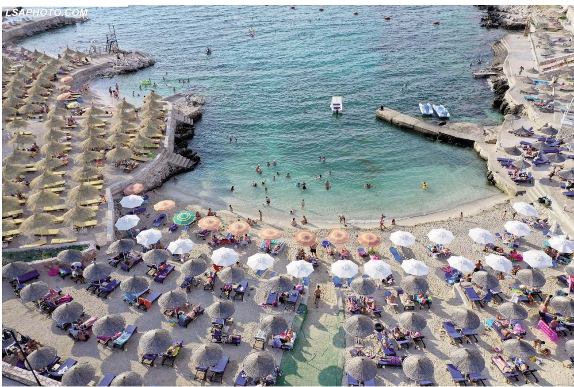
Jemi në shtator dhe në Ksamil vazhdon të bëhet plazh