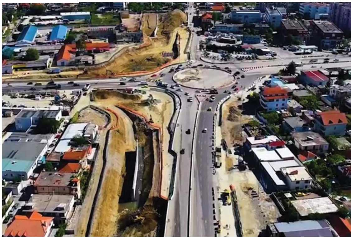
Pamje nga punimet e unazës së madhe në Tiranë