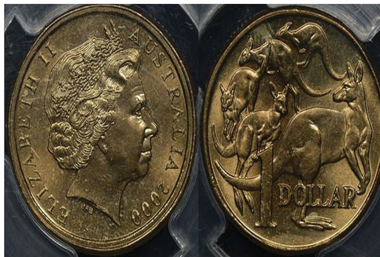
Australia 2000 $1/10c Mule Error Uncirculated PCGS UNC Details