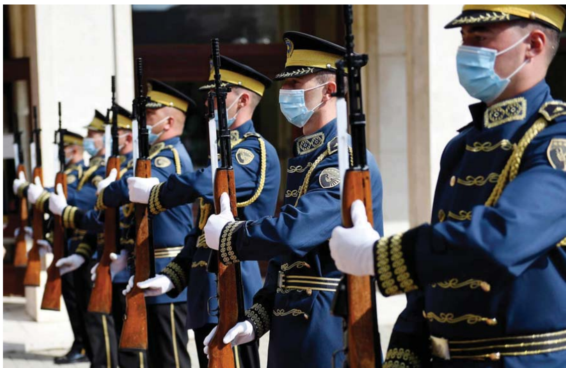
Togu Ceremonial i Forcës së Sigurisë së Kosovës (FSK)