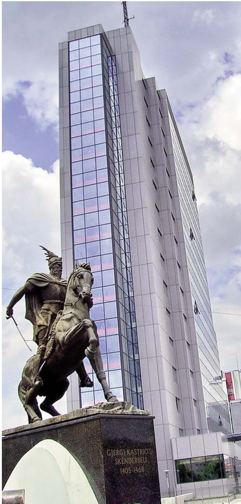
Qeveria Hoti dhe sundimi i ligjit

Më tutje në këtë komunikatë të vlerësimit të 100-ditëshit të qeverisë Hoti thuhet se për shkak të mungesës së një shumice parlamentare, qeverisë iu deshën dy muaj për ta miratuar rishikimin e buxhetit, për të ekzekutuar pagesa nga pakoja e emergjencës, për t'i ratifikuar kreditë ndërkombëtare dhe për t'i elaboruar politikën e paketës së rimëkëmbjes. "Qeveria nuk ka ofruar ende një perspektivë të qartë qeverisëse ndaj disa sferave të sektorit publik, si: çfarë do të ndodhë me ligjin e ri të pagave? Si do të financohen projektet e infrastrukturës publike dhe mbi çfarë kriteresh do të zbatohen ato? A do të ketë një sistem merite për emërimin në pozita të larta, sidomos në fushat siç janë ndërmarrjet publike apo agjencitë ekzekutive", thuhet në këtë komunikatë.