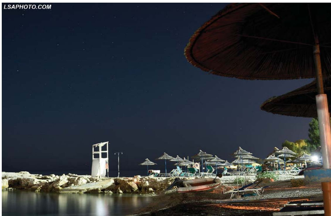
Panorama mahnitëse që na ofron Radhima