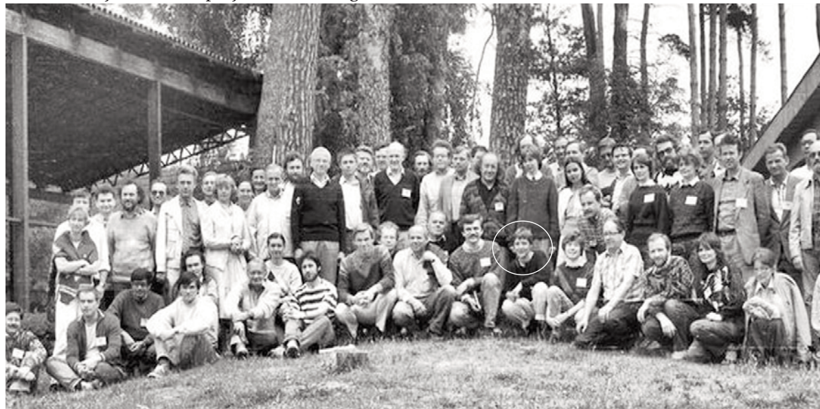
Ne foto: Angela Merkel (përpara e gjashta nga e djathta) dhe Joachim Sauer (rreshti i parë në këmbë, i shtati nga e majta) - Shkolla verore në Bachotek, Poloni