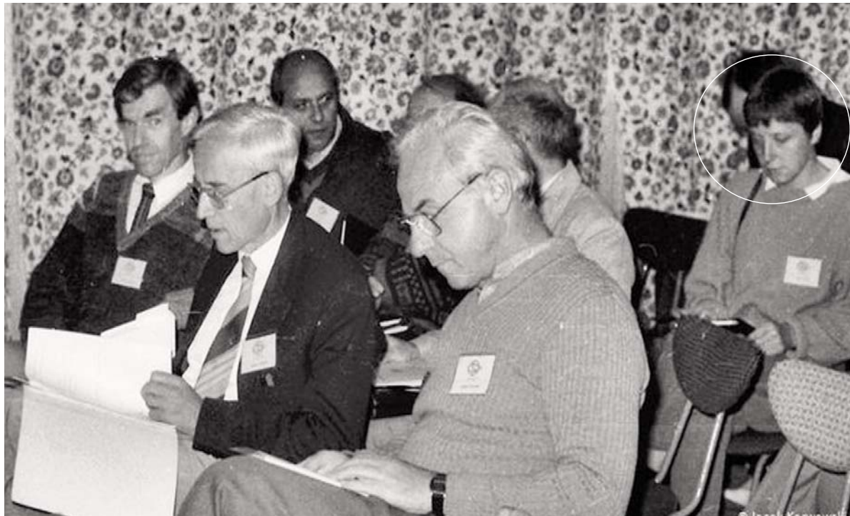
Foto: Angela Merkel (djathtas) - Shkolla verore në Bachotek; Poloni 1989

"Më 12 gusht ata kthehen. Në kufirin pranë Frankfurtit mbi Oder, rojet kufitare të RDGJ-së jo vetëm që kontrolluan dokumentat e tyre, por edhe çantën e Merkelit. Aty do të gjenin dokumenta të Solidarno??-it: dy foto të memorialit të punëtorëve të vrarë në kryengritjen e vitit 1970, një revistë dhe një distinktiv",