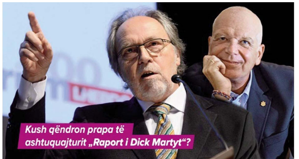
Kush qëndron prapa të ashtuquajturit „Raport i Dick Martyt“?