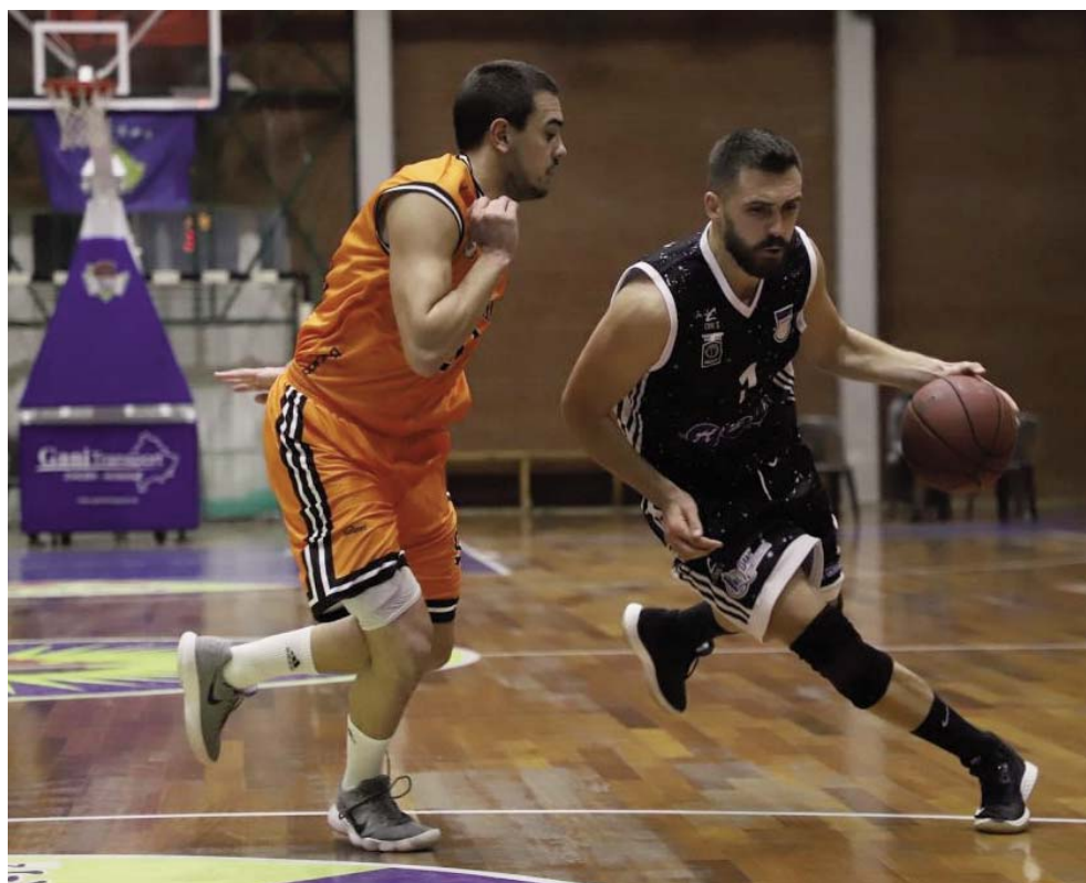
Sot zhvillohen derbi Prishtina - Peja

Sot (e enjte) do të përballen skuadrat me rivalitet të madh, Sigal Prishtina do ta presë Pejën në një sfidë shumë interesante. "Bardhekaltrit" kanë dy fitore dhe pesë humbje, kurse pejanët janë në vendin e parë me gjashtë fitore dhe një humbje. Këto dy skuadra do të ballafaqohen edhe në çerekfinale të Kupës së Kosovës. Trepça dhe Bashkimi janë dy skuadra me traditë në basketbollin e Kosovës. Sfidat në