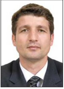
Shkruan: Agron HOTI

Edhe nëse nuk kishte pasur 'konkurs publik' për këtë 'garë' të pandershme, të gjitha veprimet shkonin në atë drejtim, pra po 'garohej' se kush po e paraqiste më keq Kosovën e mitur, e cila në vitin 2015 s'kishte më shumë se shtatë vjet shtet. Pra, po ndërtohej një narracion aq përmbysës sa thua ti, gabim paska qenë formimi i shtetit të Kosovës. Deri këtu shkohej.