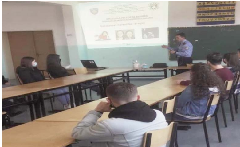
Policisë së Kosovës. Sipas kësaj komunikate, në

kryesisht për temën "Substancat narkotike dhe pasojat e tyre" dhe janë zhvilluar në shtatë shkolla (tri shkolla të mesme dhe katër shkolla të mesme të ulëta). "Interesimi ka qenë mjaft i madh për pjesëmarrje duke pasur bashkëbisedim mes policisë, nxënësve dhe arsimtarëve se si duhet mbrojtur veten, parandaluar dhe raportuar këtë dukuri të dëmshme shoqërore. Pjesëmarrja e nxënësve në këto ligjërata për gjithsejtë pesë shkolla arrin 230 nxënës", është thënë në komunikatën e