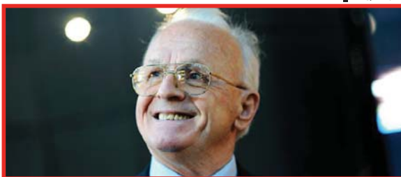
Shkruan: Behxhet Sh. SHALA - BAJGORA