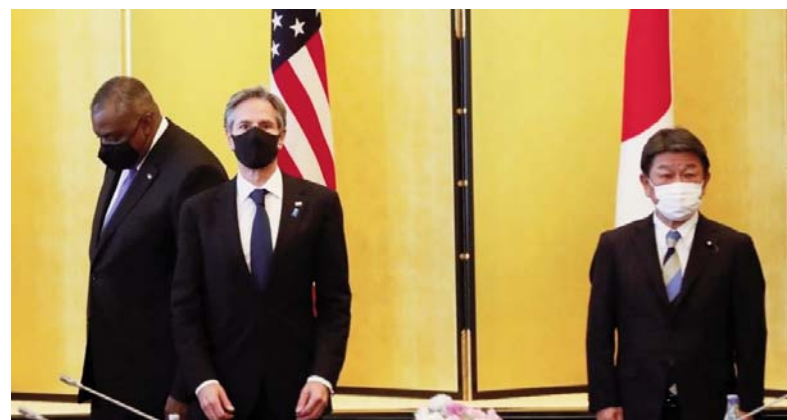
më 17 mars dhe do të zhvillojnë në kryeqytetin e Koresë së bisedime me homologët e tyre Jugut.

furnizimit në të ardhmen. Koreja e Veriut ka të ngjarë të jetë në krye të rendit të ditës pasi Shtëpia e Bardhë tha se ky vend, deri më tani, kishte kundërshtuar përpjekjet e Shteteve të Bashkuara për t'u përfshirë në dialog. Në hapjen e takimit dypalësh me ministrin e Jashtëm të Japonisë, Toshimitsu Motegi, Blinken tha se ai dëshironte të punonte me Japoninë dhe aleatët për denuklearizimin e Koresë së Veriut. Blinken dhe Austin do të udhëtojnë nga Tokio në Seul