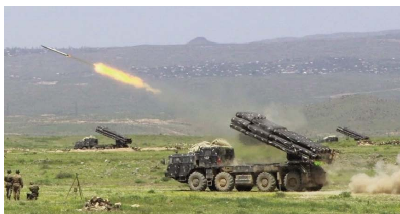
aftësinë mbrojtëse të trupave të burimeve", ka thënë dhe përdorimin e përgjithshëm zëvendësministri i Mbrojtjes i

JEREVANI, 16 MARS - Një ditë pasi Azerbajxhani nisi stërvitjet ushtarake katërditore, edhe Armenia ka filluar të martën ushtrimet ushtarake të shkallës së gjerë. Të dyja vendet, në fund të vitit të kaluar, u përfshinë në një konflikt të armatosur për rajonin e Nagorno Karabakut. Në stërvitjet e Armenisë do të marrin pjesë 7 500 ushtarë, rreth 100 tanke dhe automjete të blinduara, rreth 300 artileri dhe sisteme anti-ajrore dhe avionë. "Çdo stërvitje ushtarake ka qëllimin e qartë që ta kontrollojë