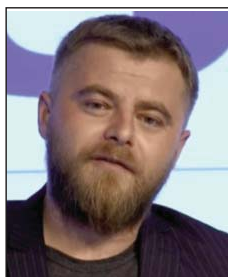
Shkruan: Ismail TASHOLLI

Më 29 janar 2001, në një gazetë të përditshme kishte dalë një titull: “Grafite me përmbajtje fyese kundër UÇK-së”. Në ato grafite, të shpërndara në muret e një qyteti të Kosovës, shkruante: “Poshtë UÇK-ja”.