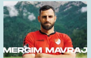
komunitet për të arritur të suksesi".

shumë gjëra që kanë dalluar dhe kanë formuar karrierën time. Mund të zgjidhja ndonjë rrugë më të lehtë, por nuk më pëlqen t'i bie shkurt ashtu sikurse edhe Turgucu Munchen nuk i pëlqen të gjejë rrugën e lehtë. Do të punojmë së bashku si