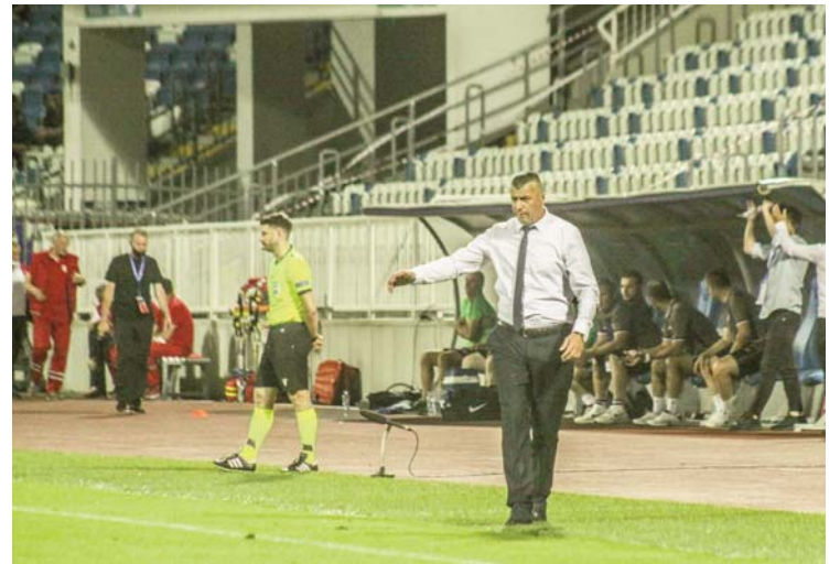
skuadrës së KF ‘Llapi’”, ka shtuar Batatina.

luanët e KF ‘Llapi’ për luftën e pakompromis në fushë dhe paraqitjen shumë dinjitoze. Do t’ju premtoj se KF ‘Llapi’ prapë do të jetë skuadër që do ta kërkojë Evropën për çdo vit dhe do të jemi skuadër shumë solide në vazhdimësi. Faleminderit për të gjithë që më mbështetën dhe më qëndruan afër gjatë kohës sa ishim në organizimin e ndeshjeve të Evropës! Jam i lumtur edhe për tifozët që u rikthyen në tribuna. Kjo ishte një e arritur e madhe falë organizimit të mirë të klubit dhe stafit që pas një kohe të gjatë ata të jenë të pranishëm në ndeshje. Vazhdojmë të bashkuar edhe më të fortë se kurrë drejt realizimit të synimeve të