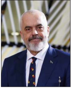
Shkruan: Edi RAMA, kryeministër i Shqipërisë

Dje pata kënaqësinë e posaçme të kem për vizitë nga Kosova dy vajzat e arta shqiptare të Tokios, së bashku me trajnerin e tyre fenomenal. Kërkuam të më takonin dhe u ndjeva shumë i nderuar. Biseda me vajzat e me trajnerin dhe miqtë që i shoqëronin ishte frymëzuese dhe me disa ide të bukura bashkëpunimi që u pajtuam t'i zhvillojmë së bashku. Kur kërkuam të dilnim edhe në fotografi, u thashë: “Po unë jam tradhtar, s'dua t'ju hap telashe!”. Qeshën shumë në fakt dhe i bëmë fotografitë që kishin dëshirë edhe t'i publikoja në faqen time. Mirëpo, siç e prisja, ushtria digjitale e, kinse patriotëve matanë kufirit, që të sharat e