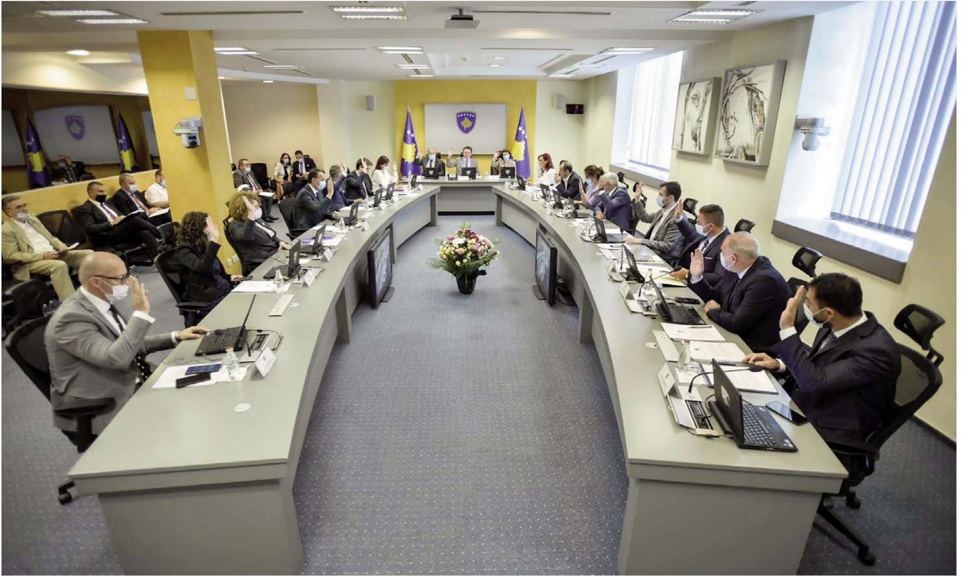
ËSHTË MBAJTUR MBLEDHJA E QEVERISË SË KOSOVËS