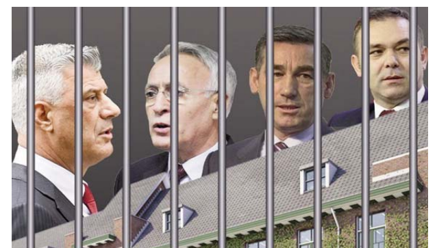
(Zani me jehona, nga bugu i Hagës, i 4 Heronjve të Luftës Çlirimtare e të Paqes):

Zërin e Zotit: "Djemtë e tu,o nanë, plotësisht të pafajshëm!"