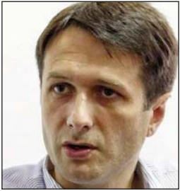
Shkruan: Valon MURATI

Zhvillimet dramatike këto ditë në Afganistan, ato të paradokohshmet në Nagorni Karabah, mbi të gjitha ndryshimet gjeopolitike me forcimin e Kinës dhe rikthimin e Rusisë si aktor global, dëshmojnë një gjë: status quot janë të paqëndrueshme. Duke i lexuar drejt këto zhvillime, në rastin tonë duhet ta kuptojmë se