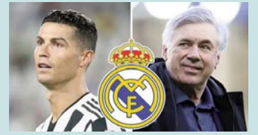
bujshëm të CR7. Marrëdhënia mes të dyve është shumë e mirë".

komunikime të vazhdueshme dhe mund të arrihet një marrëveshje. Carlo Ancelotti dëshiron ta rikthejë Cristiano Ronaldon te Real Madridi dhe është e gjitha e vërtetë. Ai këmbëngul në një rikthim të