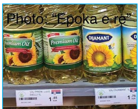
PLOT PRODHIME SERBE NË PRISHTINË GAROJNË MES TYRE, NDONËSE ME ÇMIME DYFISHE