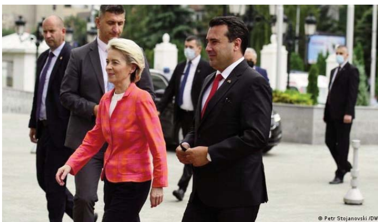
Presidentja e KE, von der Leyen u takua edhe me kryeministrin Zoran Zaev

Kosovë - Serbi është shqetësuese. Është thelbësore të ulen tensionet dhe t'i rikthehen dialogut", theksoi ajo në konferencën e shtypit në vizitën e saj disaorëshe në Tiranë të martën (28.09). Kurse pas takimit me kreun e qeverisë së Maqedonisë së Veriut, Zoran Zaev në Shkup ajo u shpreh se "tani ka rëndësi çtensionimi". Ursula von der Leyen kujtoi historikun e themelimit të BE si model për Ballkanin. "Edhe BE u ndërtua në bazën e dialogut në fillimet e veta dhe më pas u