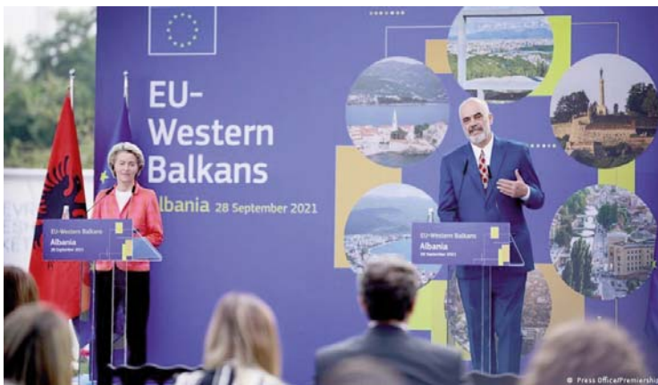
Ursula von der Leyen në Tiranë

bazua në zhvillimin ekonomik. Kjo solli mirëkuptim nga të gjitha palët dhe më pas pajtim. Ky është një proces i gjatë, që sjell një të ardhme me paqe dhe begati. Këtë dëshirojmë që të arrijmë", tha von der Leyen. Mbi konfliktin aktual Kosovë-Serbi u shpreh në konferencën për shtyp me presidenten e KE në Tiranë edhe kryeministri Rama. „Paqja e shumëkërkuar është e papërfunduar pa zgjidhur njëherë e mirë çështjen e njohjes së Kosovës. „Kjo kërkon durim, dialog dhe krijim të besimit reciprok mes palëve" theksoi ai.