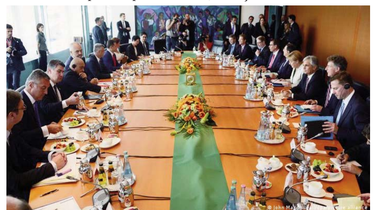
Takimi i parë në kuadër të Procesit të Berlinit, 28 gusht 2014

Presidentja e KE, Ursula von der Leyen theksoi edhe njëherë mbështetjen e BE për Ballkanin Perëndimor. Me shifra konkrete në Tiranë ajo theksoi mbështetjen që jep BE. BE i ka dhënë Shqipërisë 230 milionë euro grante dhe financime për rimëkëmbjen nga pasojat e pandemisë Covid -19, tha von der Leyen. Por kjo është një rimëkëmbje "që do të zgjasë me vite, solide pasi qytetarët e Shqipërisë dhe sidomos rinia meritojnë një të ardhme të gjelbër dhe më dixhitale. Ata kanë nevojë për vende pune, që janë të mirëpaguara. Ky është në fakt Plani ynë Ekonomik dhe i Investimeve për BP." Por sipas presidentes së Komisionit Europian, e rëndësishme është "që ju vetë keni bërë propozime për projekte cilësore, solide, të forta që së bashku të sjellim edhe 20 miliardë euro të tjera investime. Deri tani kemi sjellë 500 milionë euro dhe do të propozojmë një shtesë prej 600 milionë eurosh të tjera për këtë vit," tha ajo. /DW