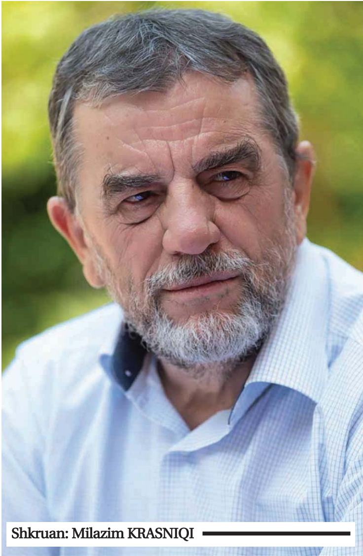
Shkruan: Milazim KRASNIQI

1. Themeli i marrëveshjes së përkohshme, që u arrit të enjten, më 30 shtator, në Bruksel, për tabelat e veturave, është se do të punohet në muajt në vijim, për të arritur një marrëveshje të përhershme. Pra, kjo është një marrëveshje e përkohshme, siç ka qenë e përkohshme edhe ajo para saj, e cila, kur skadoi, shkaktoi krizën. Nëse nuk gjendet një marrëveshje e përhershme më vonë, edhe kjo e sotnja mund ta kthejë krizën. Në fakt, marrëveshjet e përkohshme janë në pajtim me konceptin që ka Serbia për institucionet e Kosovës, “institucionet e përkohshme kosovare” (privremene kosovske institucije.) Pra, çdo marrëveshje që e ka karakterin si e përkohshme, është më shumë në favor të Serbisë e më shumë në dëm të Kosovës. Edhe kjo marrëveshje është e tillë. 2. Kjo marrëveshje e përkohshme është në funksion të deskalimit të situatës në pikat kufitare Jarinjë dhe Bërnjak. Pra, qëllimi i ndërmjetësuesve ka qenë të ulet shkalla e rrezikut nga ndonjë incident a konflikt në terren. Rrjedhimisht, marrëveshja e tillë është produkt i presionit të ndërmjetësve, e jo i vullnetit të palëve. Palët, po të kishin vullnet më të mirë, nuk do ta sillnin gjendjen në atë shkallë eskalimi. Edhe elementet e