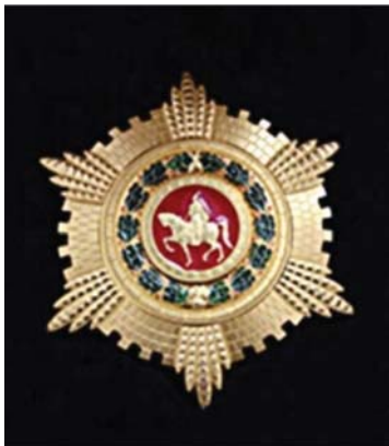
'Kalorës i Urdhërit të Skënderbeut'