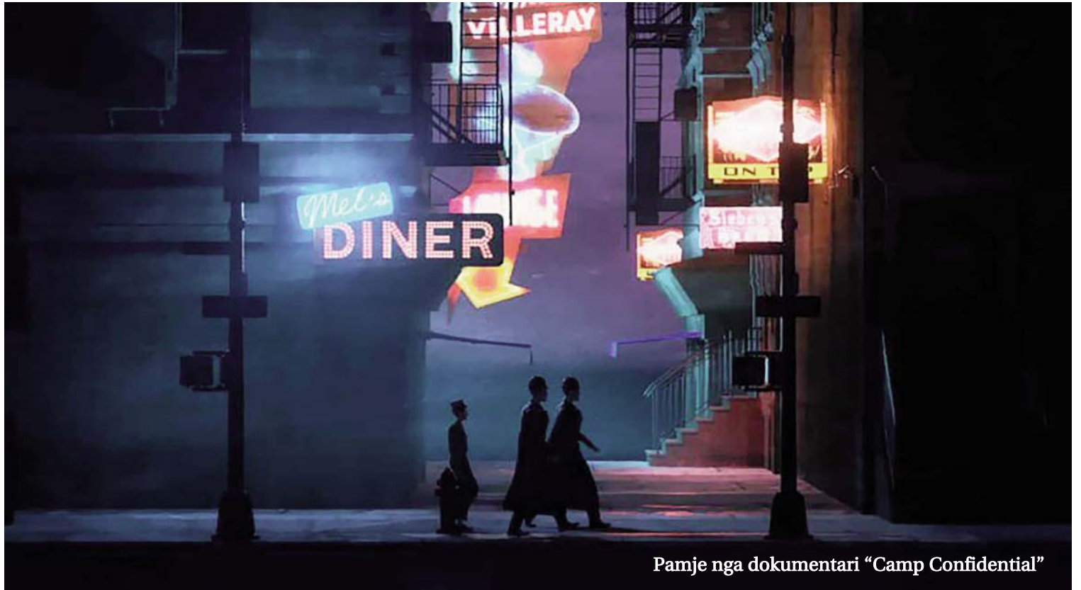
Pamje nga dokumentari "Camp Confidential"

I shkatërruar në fund të luftës dhe i varrosur në fshehtësi derisa Shërbimi i Parqeve Kombëtare zbuloi disa mbetje në fillim të viteve 2000, kampi klandestin është paralajmërim për hebrejtë modernë dhe kujtesë për ata që erdhën