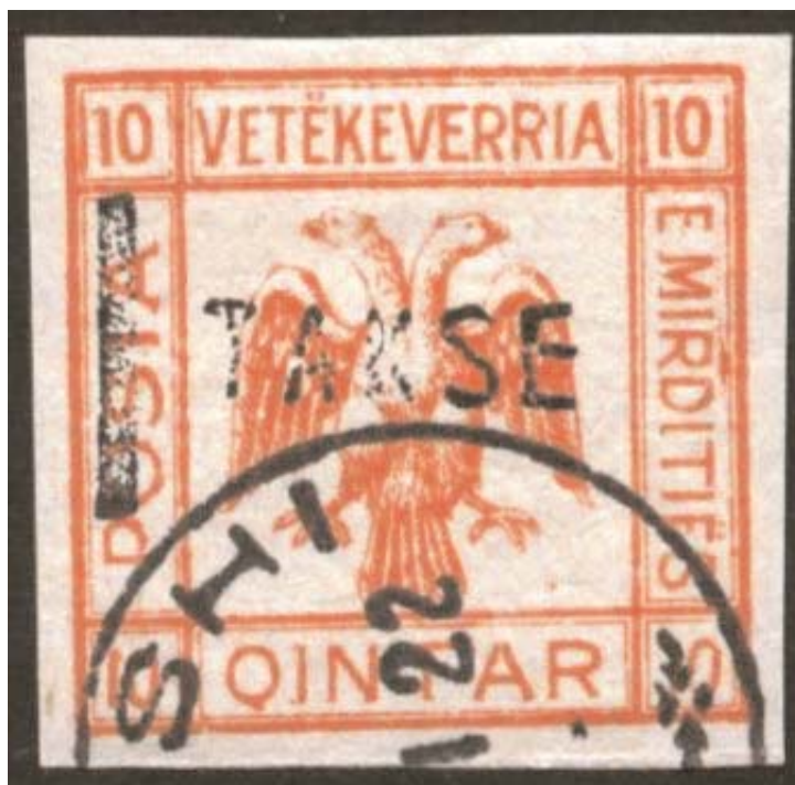
Pullë postare e "Republikë së Mirditës"

Më 1921, fitues i Nobelit për Fizikë ishte Albert Einstein. Pas këtij çmimi, Einstein u shndërrua në sinonim të gjeniut. /Telegrafi/