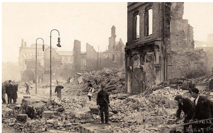
Shkatërrimet gjatë luftimeve për pavarësinë e Irlandës

Autor i himnit është shqiptari me origjinë nga Shushica e Istogut në Kosovë, Mehmet Akif Ersoj. Ndër vargjet që këndohen në himn janë edhe këto: