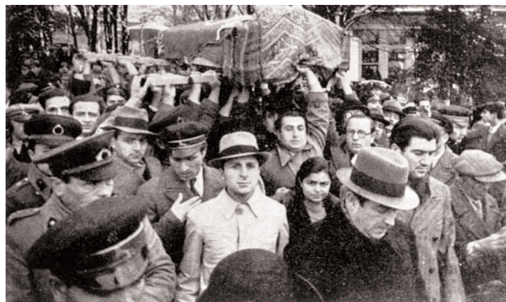
Pamje nga ceremonia e varrimit të Mehmet Akifit, më 26 dhjetor 1936 në Stamboll

Prizren, pra në Kosovën e sunduar atëbotë nga serbët, më 17 korrik të vitit 1921. Kjo republikë ishte në interesin e Serbisë sepse do ta mbante peng shtetin shqiptar dhe