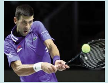
mund të futet në Australi apo jo. Kujtojmë që Australian Open nis më 17 janar.

imtësishëm dhe dokumentacioni që ai kishte, së bashku me lejen speciale, nuk ishte i mjaftueshëm, i rregullt, për t'i lejuar atij futjen në Australi. Në këtë pikë kanë hyrë në skenë avokatët e Djokoviçit që kanë apeluar këtë vendim, ndërsa përgjigja përfundimtare do të jepet të hënën, nëse do të