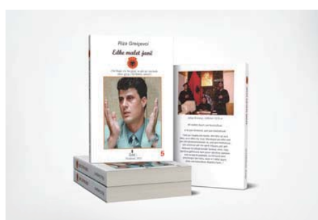
“Edhe malet janë Kosova para gjyqit, UÇK - 5