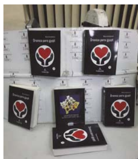
“Drenica para gjyqit” – 2