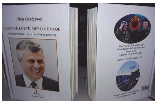
“Hero në luftë, Hero në paqe” – 1

Proteston, refuzon, mallkon, pena e shkrimtarit: Kur burgosen çlirimtarët, burgoset edhe populli! Kur burgoset UÇK-ja, burgoset edhe liria!