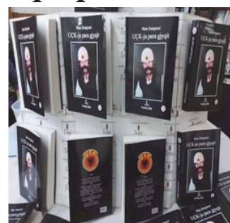
“UÇK-ja para gjyqit” – 3