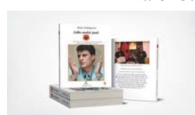
"Edhe malet janë UÇK" – 5