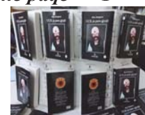
"UÇK-ja para gjyqit" – 3