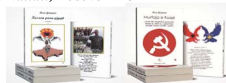
"Murtaja e Kuqe" – 6