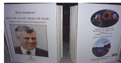
"Hero në luftë, Hero në paqe" – 1

Kur burgoset UÇK-ja, burgoset edhe liria!