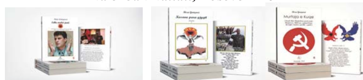
"Edhe malet janë Kosova para gjyqit, UÇK - 5