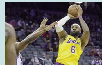
frustron yllin pasi ai po jep shifra fantastike pavarësisht se sapo ka mbushur 37 vjeç.

rezik për të luajtur në "play-in" deri në përfundimin e sezonit të rregullt. Pas fitimit të titullit të vitit 2020, Lakers nuk ka qenë në gjendje të kthehet në rrugët e fitoreve me LeBron Jamesin që ende performon në nivelin më të lartë. Kjo padyshim që e