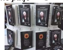
"UÇK-ja para gjyqit" – 3