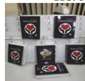
"Drenica para gjyqit" – 2