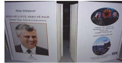
"Hero në luftë, Hero në paqe" – 1

Proteston, refuzon, mallkon, pena e shkrimtarit: Kur burgosen çlirimtarët, burgoset edhe populli! Kur burgoset UÇK-ja, burgoset edhe liria!