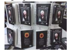
"UÇK-ja para gjyqit" – 3