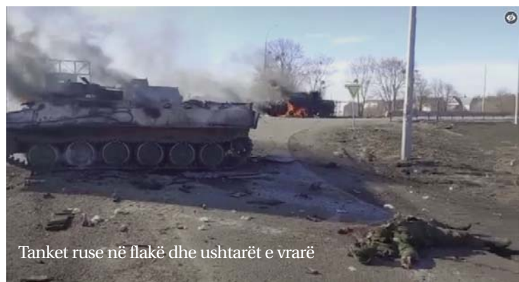
Tanket ruse në flakë dhe ushtarët e vrarë

Putini ka paralajmëruar se nëse ushtarët ukrainas nuk i dorëzojnë armët, do të jenë përgjegjës për gjakderdhjen. Menjëherë pas fjalimit të tij, u dëgjuan shpërthime intensive raketash në qytetin lindor, Kharkiv dhe më pas u dëgjuan shpërthime sporadike në periferi