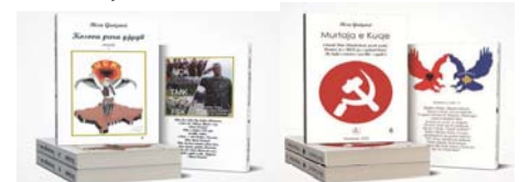
"Murtaja e Kuqe-7 dramë, 6