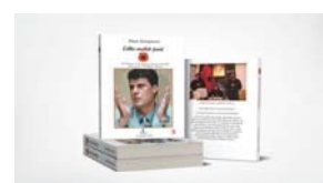
"Edhe malet janë UÇK - 5