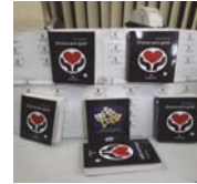
"Drenica para gjyqit" – 2