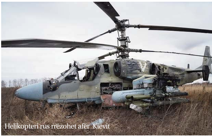
Helikopteri rus rrëzohet afër Kievit

Stoltenberg ka thënë se sulmi është një shkelje e rëndë e ligjit ndërkombëtar dhe një kërcënim serioz për sigurinë euroatlantike, ndërsa i bëri thirrje Rusisë që t'i ndërpresë menjëherë veprimet e saj ushtarake dhe ta respektojë sovranitetin dhe tërësinë tokësore të Ukrainës. "Aleatët e