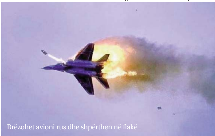
Rrëzohet avioni rus dhe shpërthen në flakë

Shtetet e Bashkuara dhe aleatët do të vendosin "sanksione të ashpra" ndaj Rusisë, pasi forcat e saj ushtarake kanë nisur sulm në Ukrainë, ka thënë presidenti amerikan Joe Biden, pas shpërthimeve që janë dëgjuar në kryeqytetin ukrainas, Kiev dhe në qytete të tjera.