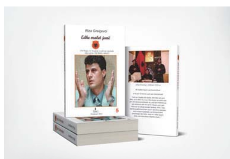
“Edhe malet janë Kosova para gjyqit, UÇK - 5