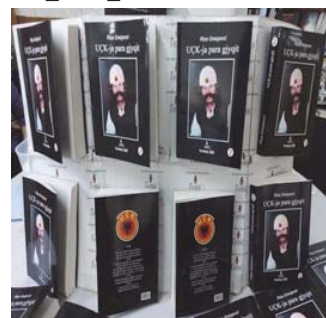
“UÇK-ja para gjyqit” – 3