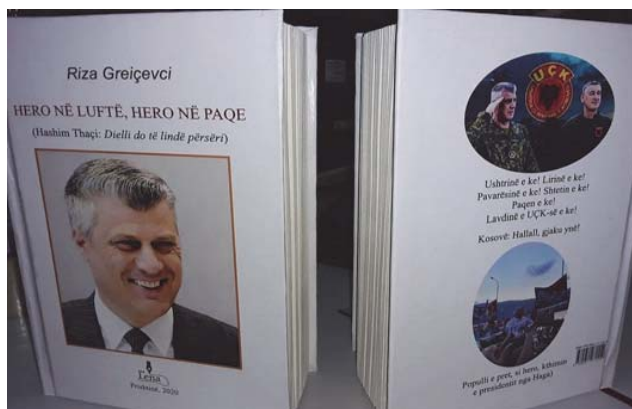
“Hero në luftë, Hero në paqe” – 1

Proteston, refuzon, mallkon, pena e shkrimtarit: Kur burgosen çlirimtarët, burgoset edhe populli! Kur burgoset UÇK-ja, burgoset edhe liria!