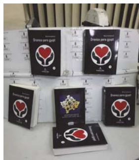
“Drenica para gjyqit” – 2