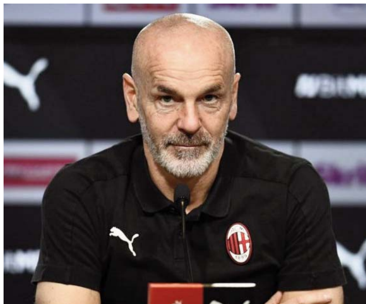
shpreh trajneri italian Pioli. Ndeshja në mes të Milanit dhe Interit fillon në orën 21:00 dhe do të zhvillohet në stadiumin “Giuseppe Meazza”.

MILANO, 28 SHKURT - Milani dhe Interi do të përballen mes vete sot (e martë), në kuadër të Kupës së Italisë. Trajneri i Milanit, Stefano Pioli, fillimisht foli për kundërshtarin, duke thënë se nuk ka parashikime për një derbi të tillë. “Sezoni ka qenë i vështirë për të gjitha skuadrat, altermojnë momentet optimale dhe më pak optimale. Kampionati është shumë i balancuar, Milani dhe Interi janë ndër skuadrat më të forta. Nesër nuk ka parashikime sepse është derbi. Si gjithmonë kush do të mund të fitojë më shumë duela individuale do të ketë më shumë shanse për fitore”, ka thënë Pioli. 56-vjeçari deklaroi se dëshirojnë të fitojnë të gjitha ndeshjet deri në fund të këtij edicioni. “Ne duam t'i fitojmë të gjitha ndeshjet. Jemi të fokusuar në ndeshjen e nesërme, sepse po kujdesemi shumë”, u