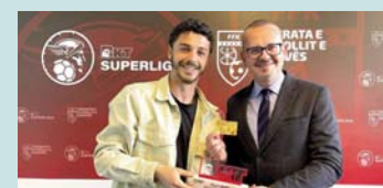
kapiteni i Kombëtares së këtij shteti.

ukrainas, të cilët pastaj u rikthyen në vendlindje. Ish-sulmuesi i Dynamo Këvit dhe Borussia Dortmundit vlerësohet si një nga futbollistët më të mirë ukrainas, teksa është edhe