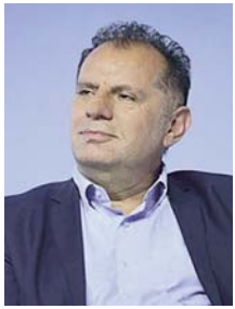
Shkruan: Safet GËRXHALIU

Pavarësia e Bankës Qendrore i referohet lirisë së saj nga ndikimi i drejtpërdrejtë politik ose qeveritar. Gjatë viteve 1970 dhe fillim të viteve 1980, ekonomitë kryesore të industrializuara të botës përjetuan periudha me inflacion të lartë. Pas këtyre periudha shumë analistë më të njohur të kohëve tentuan të analizojnë se pse bankat qendrore i lejuan ato të ndodhnin? Në bazë të krahasimeve krahasimtare të vendeve të ndryshme, shumë hulumtues kanë vënë në dukje se presionet politike ishin arsyt kryesore të inflacionit në këto vende. Politikanët e zgjedhur shpesh mund të motivohen nga konsideratat elektorale afatshkurtra, ose mund të vlerësojnë shumë rritjet ekonomike afatshkurtra, ndërkohë që në planin afatgjatë si pasojë e këtyre politikave vijnë pasojat afatgjata inflacioniste dhe luhatja së stabilitetit financiar në vend. Tendencat e politikanëve të zgjedhur për t'i shtrembëruar politikat ekonomike mund të rezultojnë shumë të dëmshme për ekonominë e