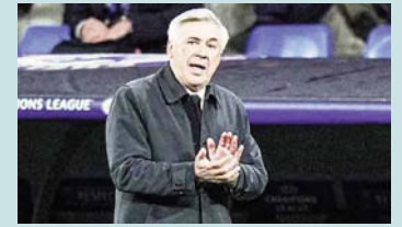
Kampionëve. Jemi mjaft krenarë me këtë arritje", ka shtuar Ancelotti.

ka thënë Ancelotti. "Kur ndeshja u bë e barabartë, ambienti na ka ndihmuar. Goli për 1-3 ka qenë një goditje psikologjike përpara, më pas e kemi ndërtuar fitoren, respektivisht kualifikimin. Është e vërtetë që Reali është mësuar në gjysmëfinale të Ligës së