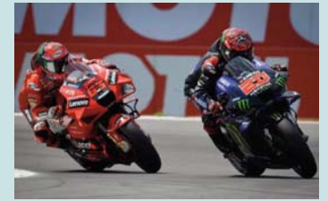
për vitin 2023. Pritet që gjithçka të vendoset brenda korrikut.

kontratë të sigurt për vitin 2023: Francesco Bagnaia (Ducati), Marc Marquez (Honda) dhe Brad Binder (KTM). Për momentin, "El Diabolo" po sheh mundësitë, por Honda e Ducati mund t'i ofrojnë një motor kompetitiv