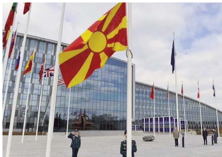
shumë vende të botës. Shtetet e Bashkuara dhe aleatët