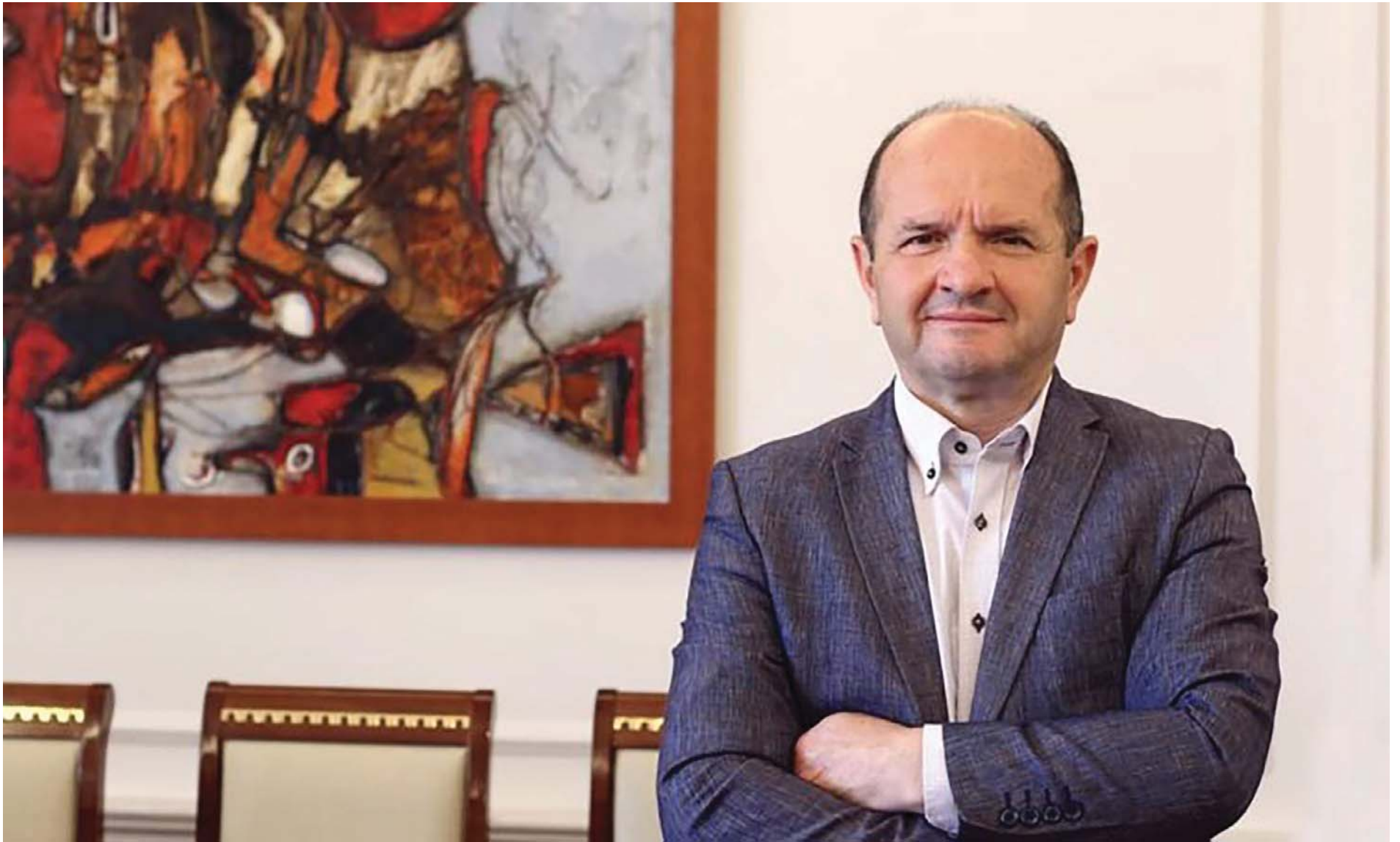
SHKRUAN: ISMAIL SYLA