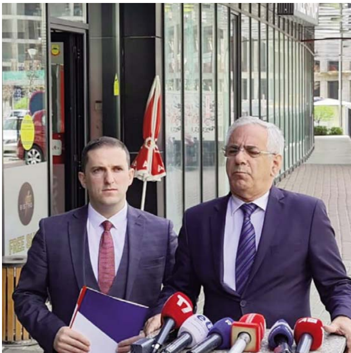
Përkundër që PDK-ja ka bërë thirrje publike për zbatimin e këtij vendimi të gjykatës, ZRRE-ja ka vazhduar ta faturojë energjinë me tarifa të shtrenjta deri në 109 %, duke u shkaktuar dëme