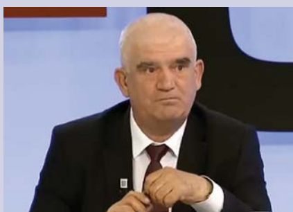
Shkruan: Kudusi LAMA

Nuk është krim krijimi dhe udhëheqja e Ushtrisë Çlirimtare të Kosovës